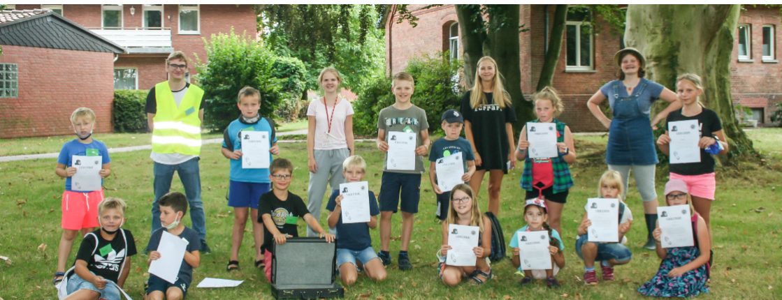
Die Gruppe vom 19.8. mit einigen Mitarbeitern

Wer ist der Täter und woher kannte er den Tresorcode? Welch ein Geheimnis verbirgt der Bankangestellte Dirk Grütze und stimmt sein Alibi? Was hat die Reinigungsfachkraft Paula Putzig im