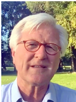
Heinrich Bedford-Strohm, Ratsvorsitzender der Evangelischen Kirche Deutschlands

Mitteln finanzierte Schiff habe am 15. August den spanischen Hafen von Burriana verlassen und sei auf dem Weg in die Such- und Rettungszone vor Libyen, teilte Sea-Watch mit. Es sei derzeit das einzige Rettungsschiff im Mittelmeer. Ursprünglich sollte die „Sea-Watch 4“ im April aus-